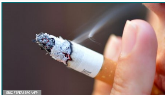
Les anciens fumeurs sont également concernés: le risque est accru de 63% pour cette frange de la population.

Cancer: trouver des soins de support adaptés près de chez soi